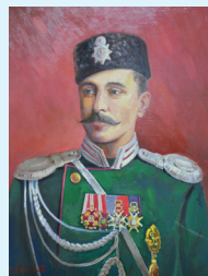
Граф Александр Дмитриевич Шереметев