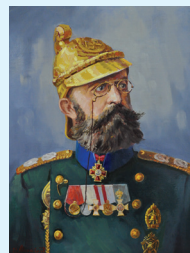
Князь Александр Дмитриевич Львов

ялось фактически единственным в России центром по решению всех проблем, связанных с пожарами. Усилиями совета Общества удалось объединить многих деятелей пожарной охраны для решения насущных вопросов пожарной безопасности. Велика была заслуга Общества в расширении противопожарной пропаганды.