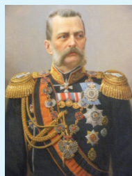
Великий князь Владимир Александрович