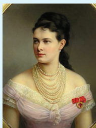
Великая княгиня Мария Павловна

В 1898 г. Российское пожарное общество стало Императорским, а почетным председателем стал Великий князь Владимир Александрович, а после его смерти (1909 г.), это дело на себя приняла его супруга Великая княгиня Мария Павловна, которая активно участвовала в работе Общества. Вторым председателем Общества был князь Александр Дмитриевич Львов.