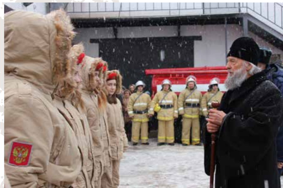
ДПК Щигры 06.02.2019 год. Курск

2 110 ← ..... Подразделения пожарной охраны, в которых организовано суточное дежурство добровольцев