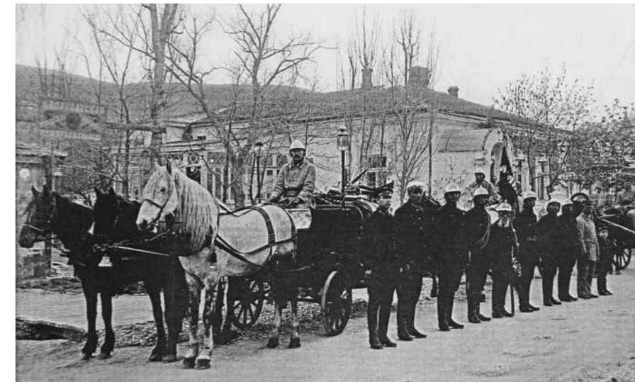
Балаклавская городская добровольная пожарная команда