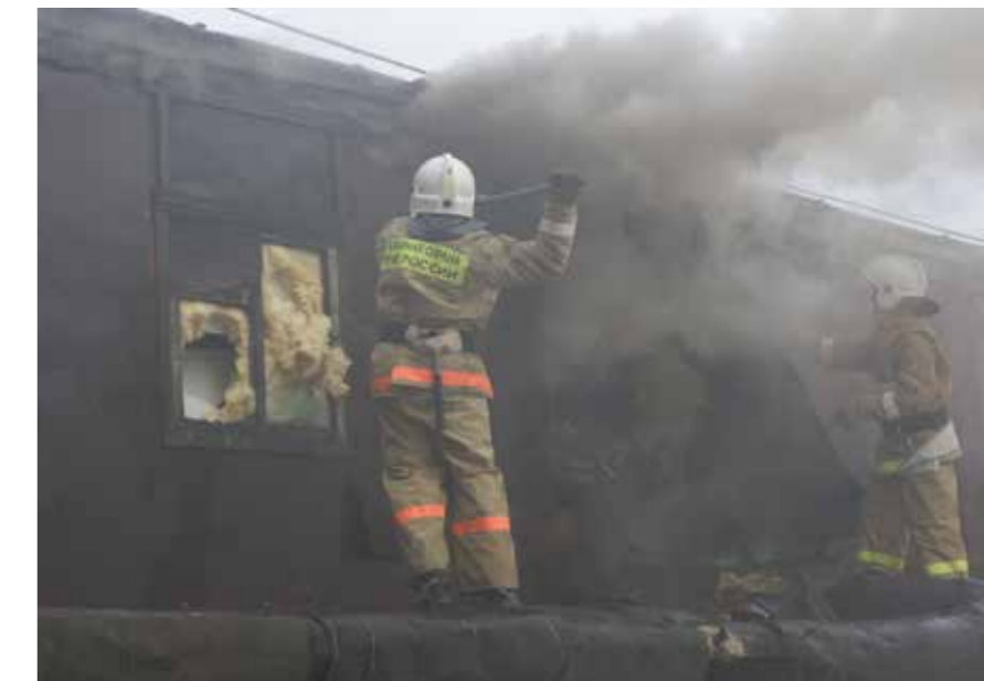
ДПО Елабуга Хабаровский район