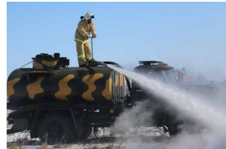
Амурск пожарный сконстр машину для тушения огня