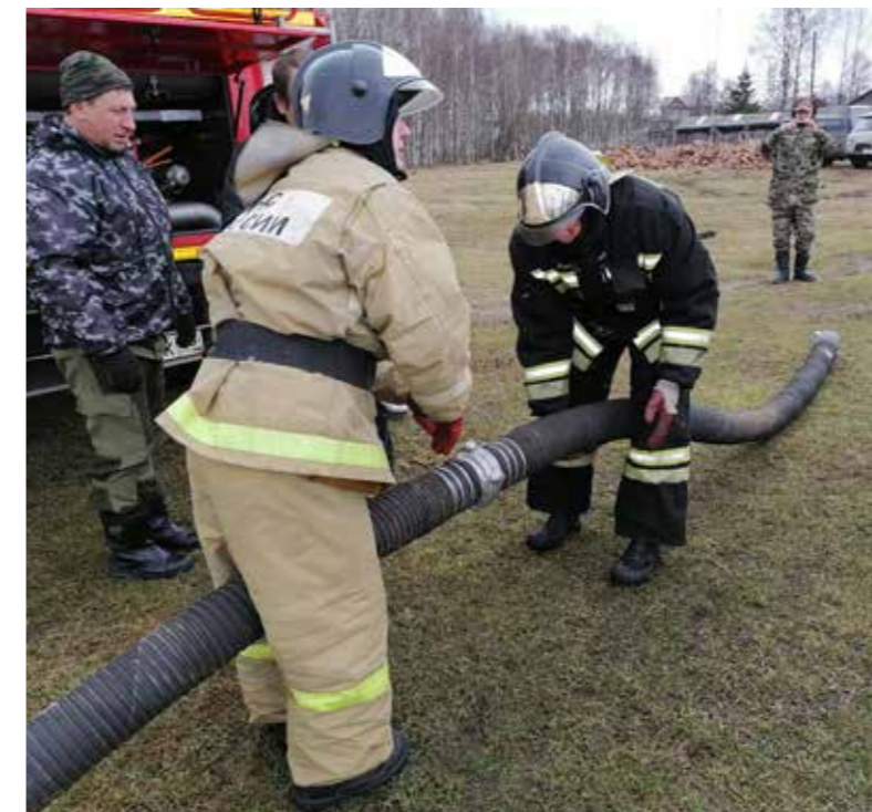
Вологодская область. 7 ПСО