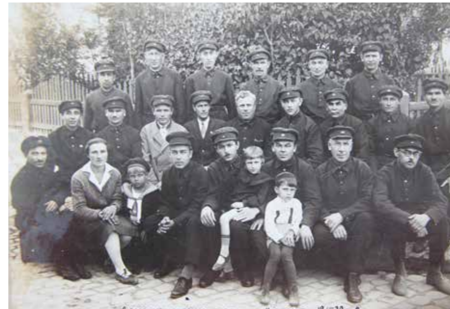
Крым. Добровольная пож.дружина