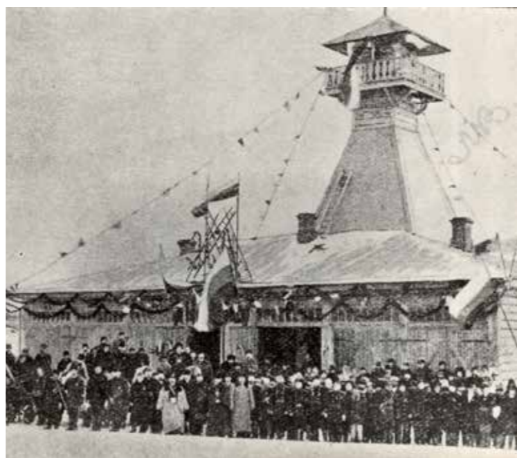
Новосибирск. Освещение пожарного депо п. Новониколаевск