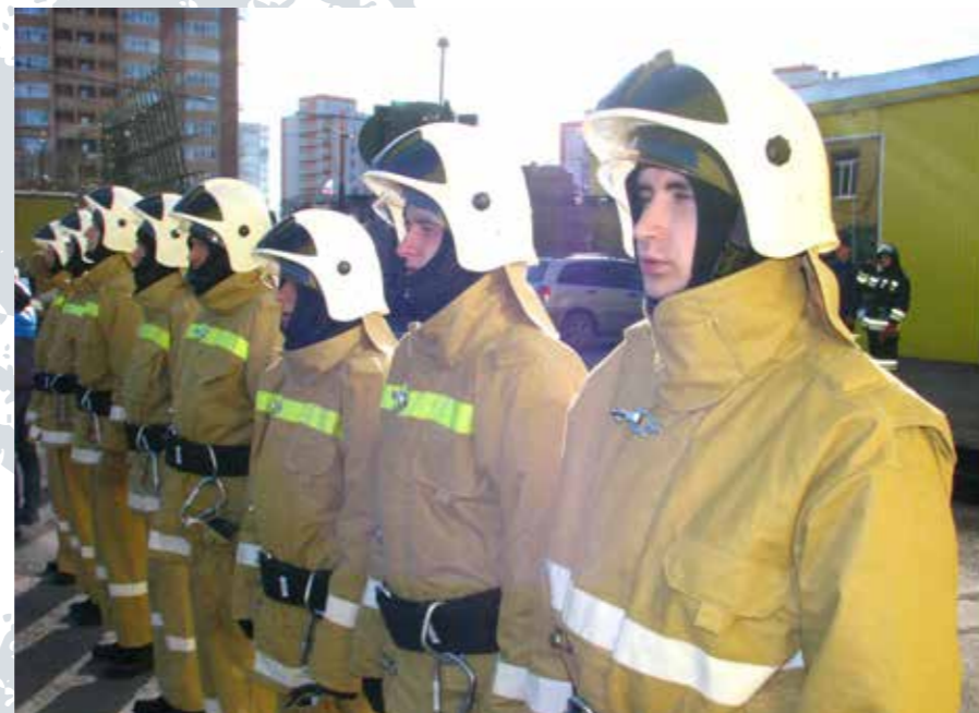
Красноярский край. ДСПСО Звезда, личный состав

Подразделения пожарной охраны, в которых организовано суточное дежурство добровольцев