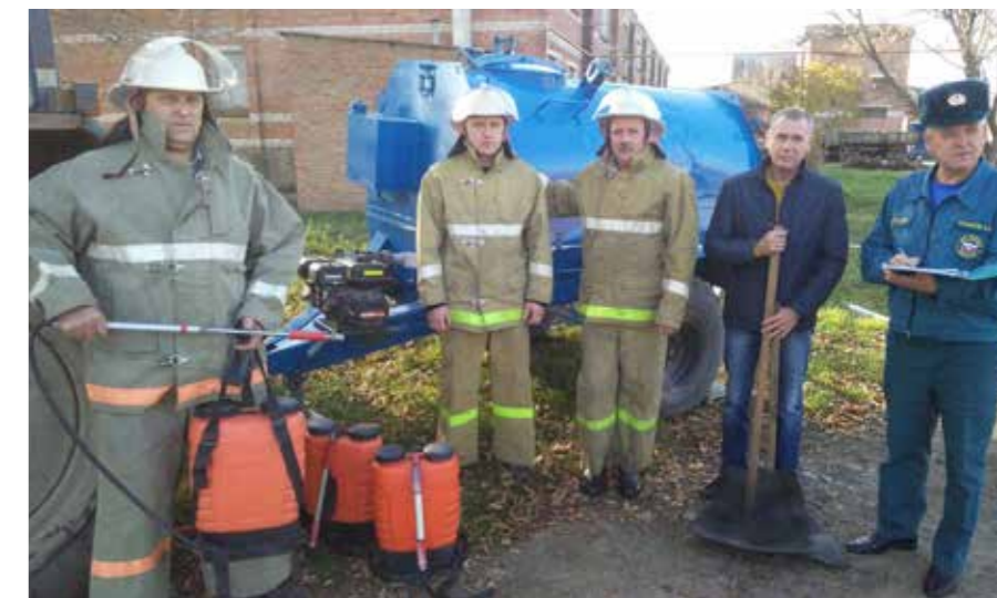
ДПК СС ПК НКЗ Кубань

9 февраля 2010 года в университете состоялось торжественное мероприятие, посвященное присвоению официального статуса спасательному отряду ДГТУ «Донской».