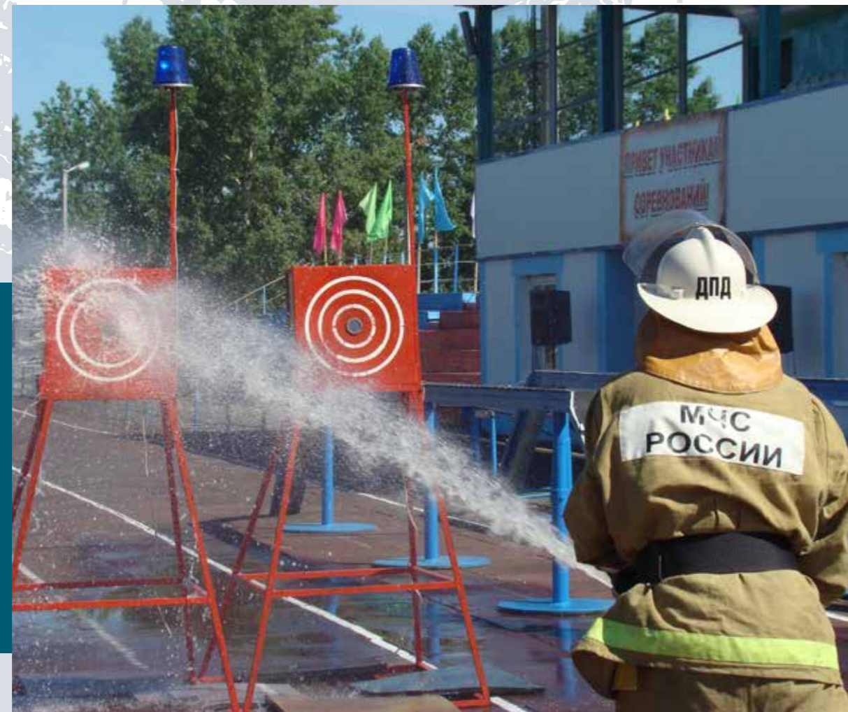
Алтайский край. Соревнования ДПК в селе Павловск