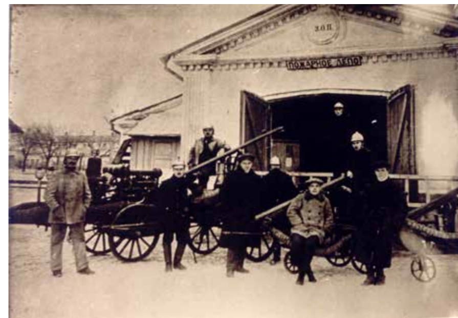
Крым. Пожарное депо