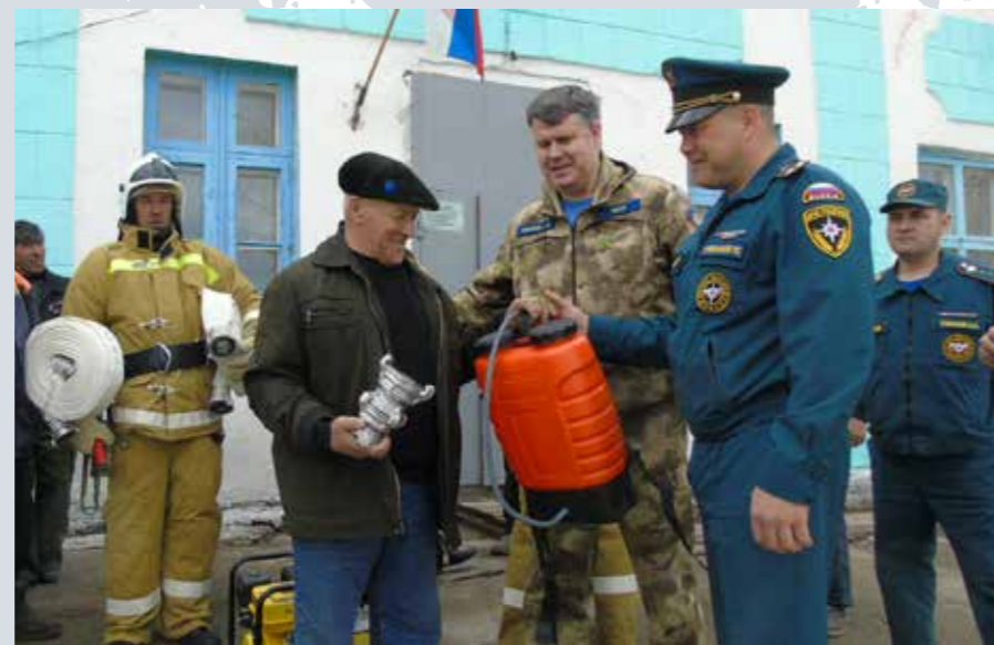
Приаргунский район, ДПД с. Бырка помощь ВДПО вручение ПТВ