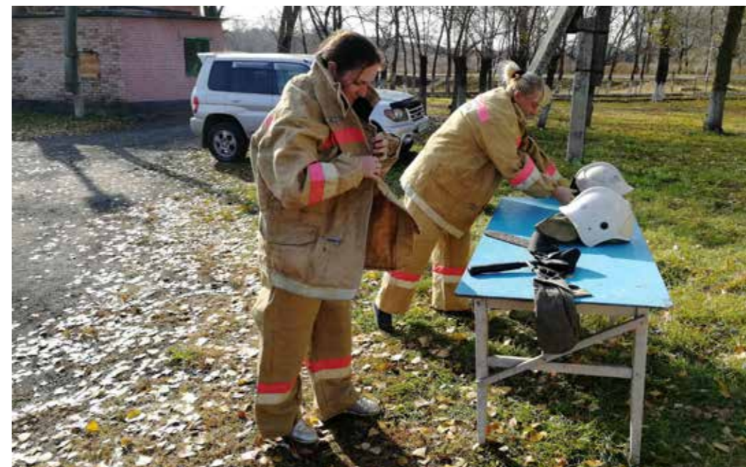
Приморск. ДПК октябрьского сельского поселения. Внутренние соревнования, 2018