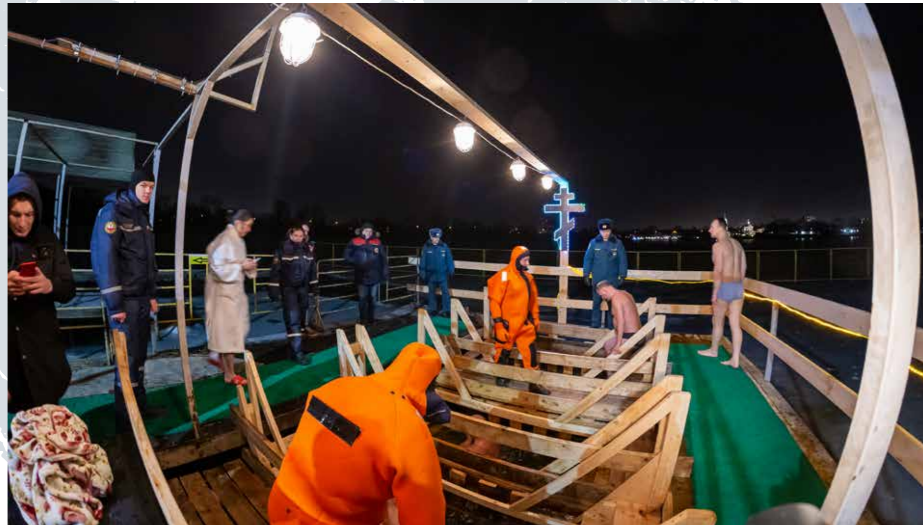
Помощь в обеспечении безопасности крещенских купаний