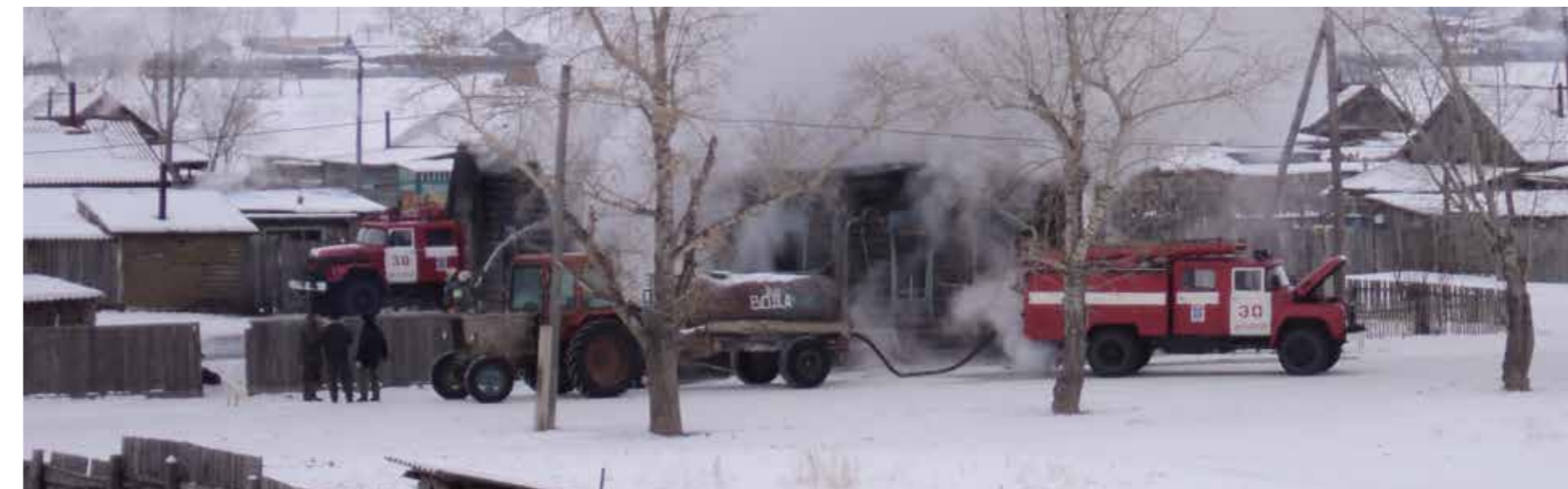
Забайкальский край Приаргунский район,, ДПД, с. Бырка. Пожар жилого дома 03.02.2011 г