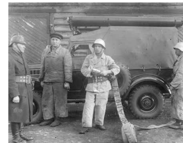
Муринское ДПО. Боевой расчет на занятиях