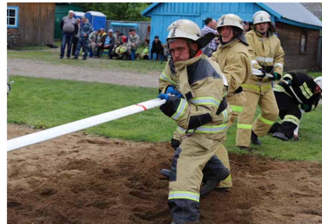
Немерово. Смотр-конкурс Лучшая ДПК Кузбасса

На протяжении длительного времени на территории Баганского района проводились соревнования по пожарно-прикладному виду спорта среди коллективов добровольных противопожарных формирований района. Началу соревнований предшествовало проведение организационных мероприятий. Руководством ПЧ-50 и сотрудниками ОГПН по Баганскому району проведена работа по привлечению команд на соревнования, приобретению необходимых материалов. Заранее была смонтирована полоса препятствий для участников эстафеты. Первые места в соревнованиях на протяжении многих лет занимает ДПК ОАО «Надежда».