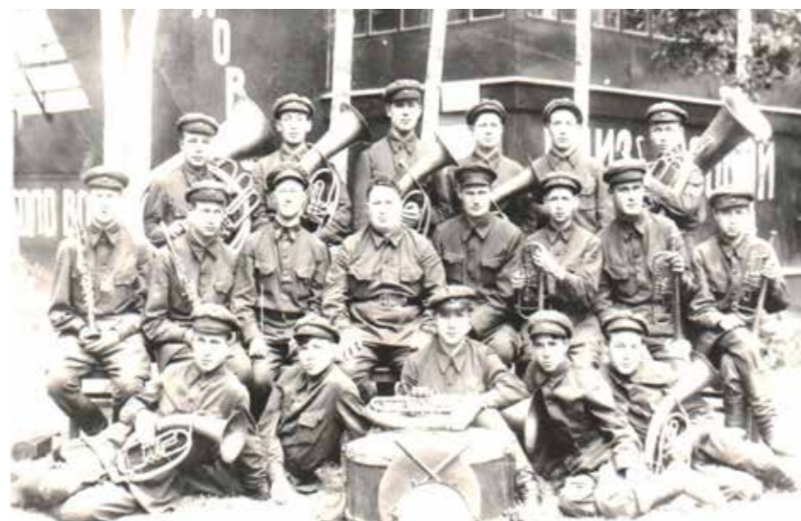
Новосибирск. Духовой оркестр