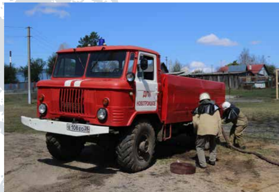
ДПК Новотроицкое и Мухинка

Подразделения пожарной охраны, в которых организовано суточное дежурство добровольцев