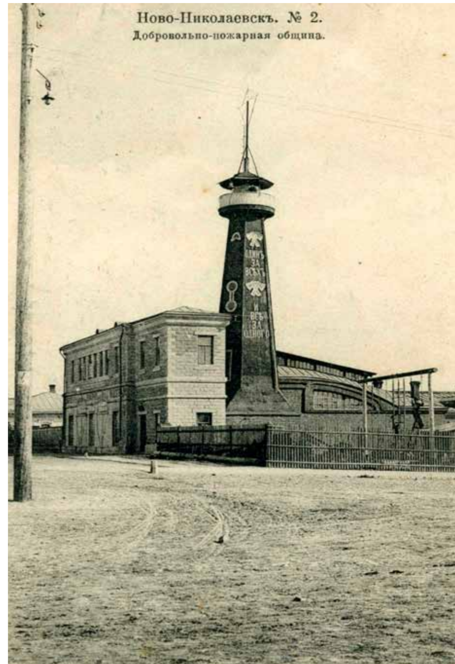
Новосибирск. Здание ДПО Новониколаевск, 1910 г.