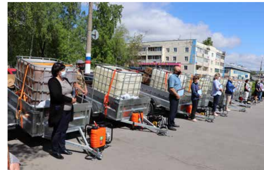
Кемерово. Вручение техники ДПК, Кузбасс