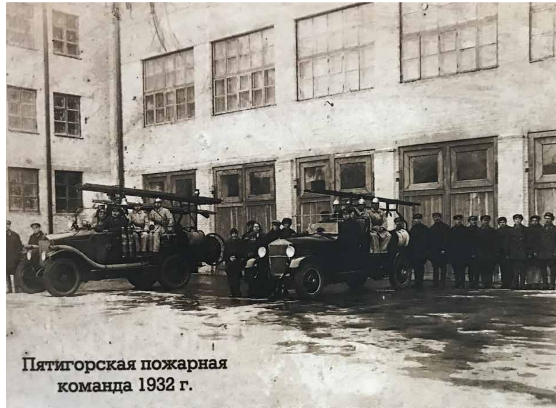
Пятигорская пожарная команда 1932 г.