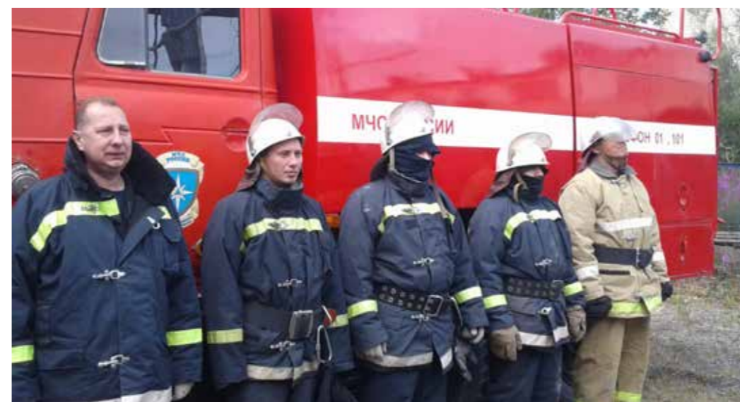
Чукотский АО. Добровольцы

В рамках муниципальной программы «Пожарная безопасность» в 2020 г. все добровольные пожарные дружины на территории Партизанского городского округа получили новое снаряжение. При этом добровольные пожарные – это не только силы быстрого реагирования при обнаружении и тушении пожара, это еще и специалисты в вопросах профилактики нарушений пожарной безопасности на территориях, обеспечивающие своевременное предупреждение и недопущение возникновения возгораний».