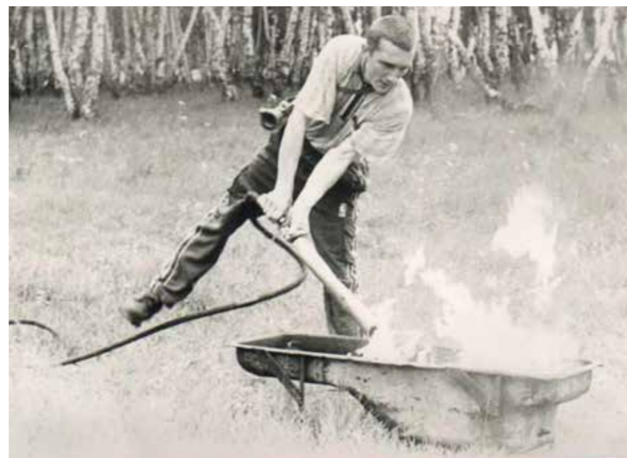
Новосибирский район. Соревнование ДПО Баганского ПСГ