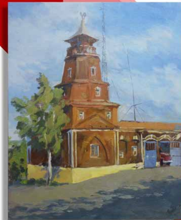
Этюд пожарной каланчи г. Сердобск Пензенской области. 10 ПСЧ ФПС ФГКУ "5-й отряд ФПС по Пензенской области". /40x50, х.м., 2018г./