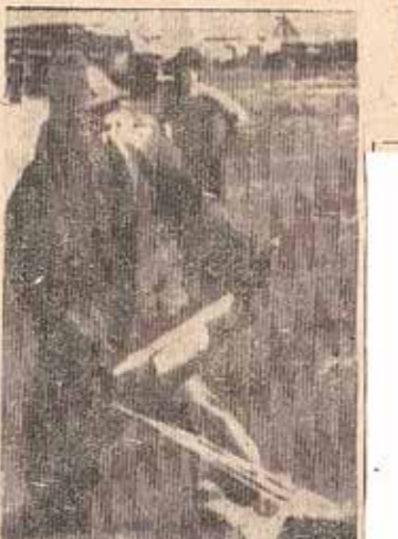
Новосибирск. Вырезка из газеты Сельский труженник