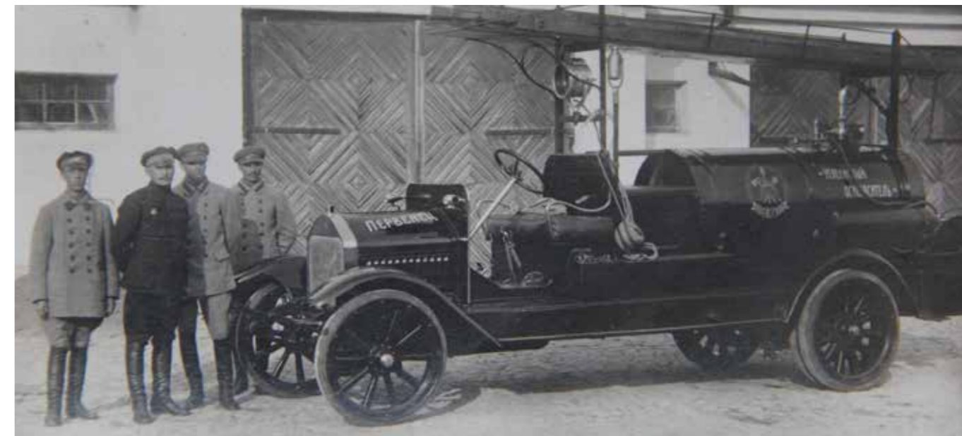
Автомобильный первенец. Крым

Становление пожарной охраны в Майкопе начинается с 1871 года.