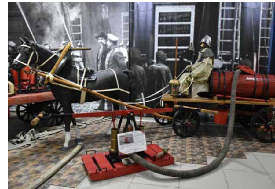
Новосибирск. Конно-бочечный ход