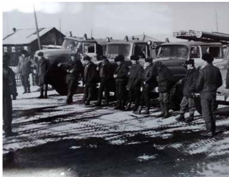
Красноярский край. Проверка состояния пожарной техники